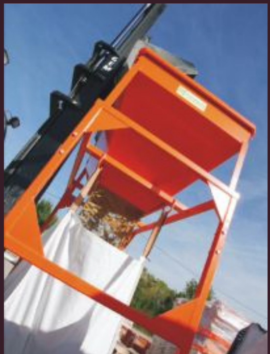
TRAMOGGE DI RIEMPIMENTO