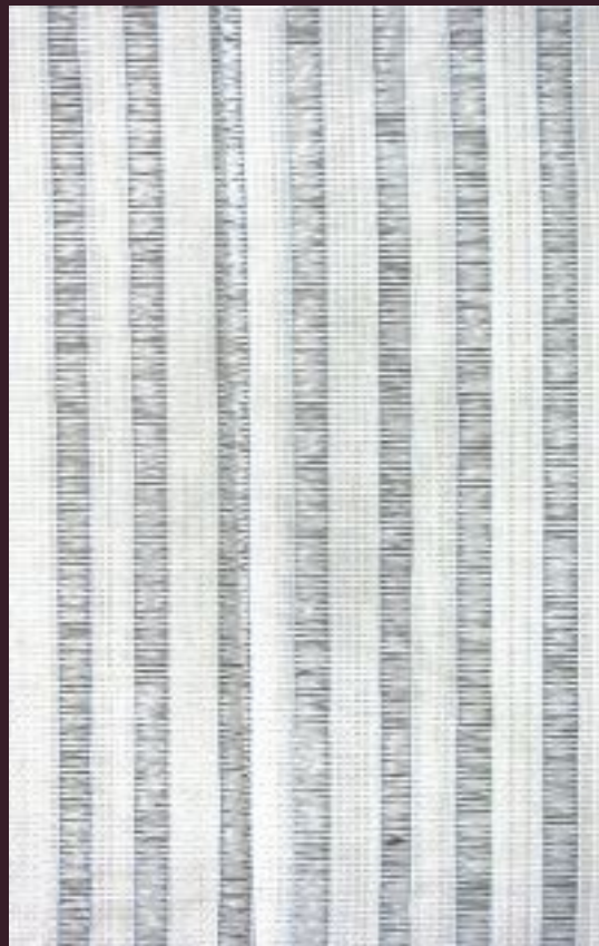
BIG BAG DRENANTI