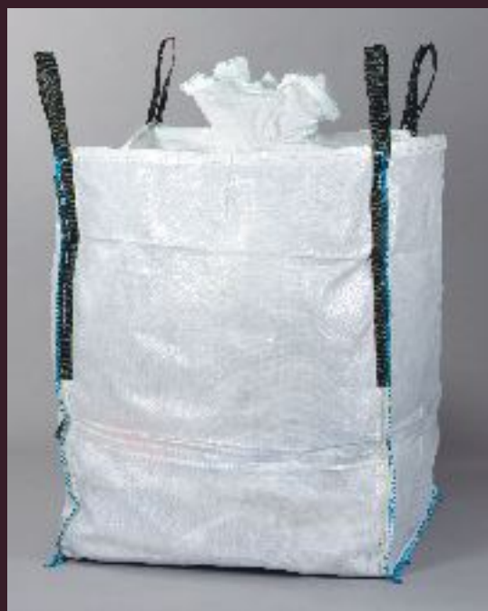
BIG BAG DEMOLIZIONE