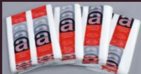
SACCHI IN POLIETILENE