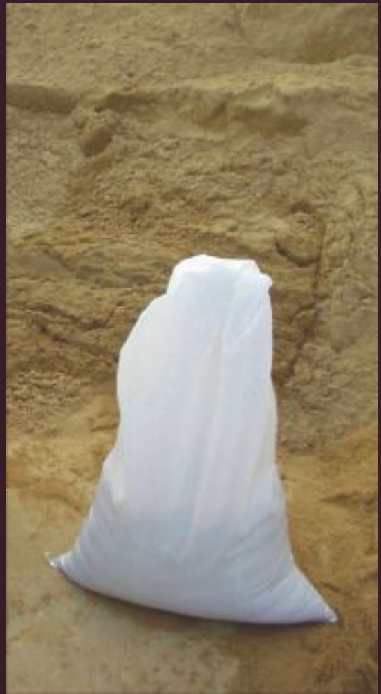
SACCHI IN TESSUTO DI POLIPROPILENE